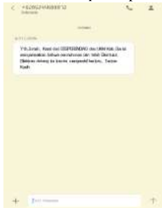
Gambar 7. Tampilan SMS Handphone Pemohon

Pesan yang diterima oleh Pemohon melalui handphone merupakan pesan pemberitahuan apakah pengajuan izin Pemohon tersebut telah disetujui atau ditolak. Untuk lebih jelasnya, tampilan SMS handphone pemohon dapat dilihat pada gambar 7.