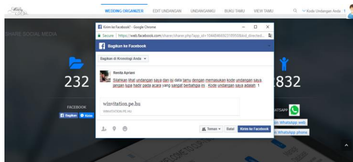
Gambar 2. Berbagi melalui Timeline Facebook.

Script yang digunakan adalah sebagai berikut: