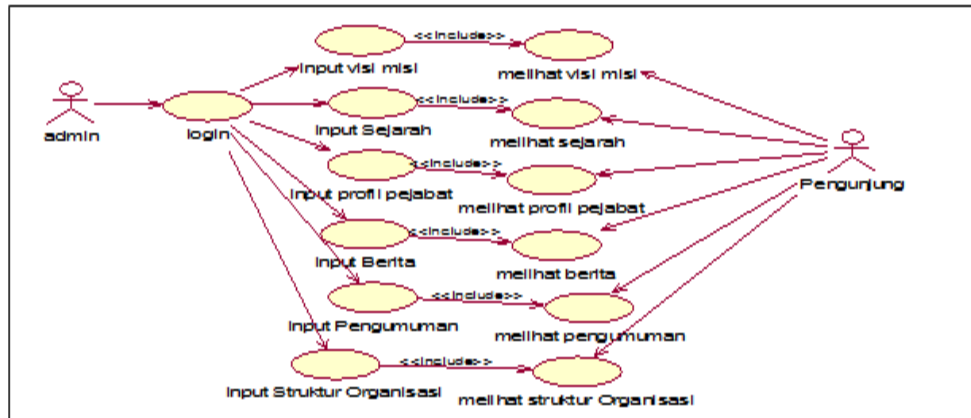
Gambar 1. Use Case Diagram

Dibawah ini adalah use case diagram sistem yang sedang berjalan di Dinas Sosial Kota Palembang. Sebagai berikut :